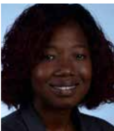
Huguette Tiegna , députée du Lot, vice-présidente de l'OPECST

Députée du Lot depuis 2017, Huguette Tiegna siège au sein de la commission des Affaires économiques. Vice-présidente de l'OPECST, elle est aujourd'hui référente sur les questions liées aux mix énergétiques et à la mobilité du futur. En mars dernier, elle a présenté devant la commission des Affaires économiques les conclusions de son rapport CAP2040 sur les scénarios technologiques permettant d'atteindre l'objectif d'un arrêt de la commercialisation des véhicules thermiques en 2040. Après l'obtention de sa licence en électronique et système d'informations au Burkina Faso, Huguette Tiegna rejoint l'École des mines, de l'industrie et de la géologie de Niamey, au Niger. En 2009, elle obtient son diplôme d'ingénieure en génie électrique et rejoint l'université du Havre, pour y poursuivre une thèse sur la modélisation et le dimensionnement de génératrices adaptées aux turbines de l'éolien. Docteure en génie électrique en 2013, Huguette Tiegna rejoint l'entreprise Whylot à Figeac, dans le Lot, spécialisée dans la miniaturisation des moteurs électriques pour l'industrie et le transport.