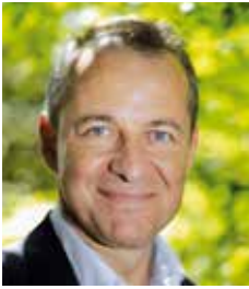
Jean-François Husson , sénateur de Meurthe-et-Moselle, vice-président de la commission des Finances