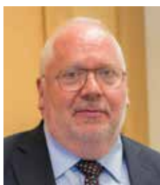
Lord Toby Harris of Haringey , membre de la Chambre des Lords, membre du Joint Committee on the National Security Strategy - UK Parliament