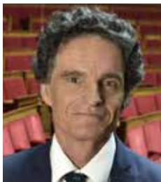
Paul Molac , député du morbihan, membre de la commission des Lois

Membre de la commission des Lois de l'Assemblée nationale, Jean-Michel Mis a été co-rapporteur de la mission d'information sur les blockchains, vice-président des groupes d'études « Cyber sécurité et souveraineté numérique », « santé et numérique » et membre du groupe d'études « Économie numérique de la donnée, de la connaissance et de l'intelligence artificielle ». Il est membre du Conseil national du numérique. Il est auditeur de la première session nationale souveraineté numérique et cyber sécurité de l'INHESJ (Institut national des hautes études de la Sécurité et de la Justice) et de l'IHEDN (Institut des hautes études de Défense nationale). Il est membre de l'Assemblée parlementaire franco-allemande. Jean-Michel Mis est aussi Colonel de la réserve citoyenne de la gendarmerie. Jean-Michel Mis est titulaire d'une maîtrise en droit privé. Il a travaillé en qualité d'attaché parlementaire au Parlement européen et à l'Assemblée nationale, mais aussi comme conseiller financier et conseiller en gestion de trésorerie.