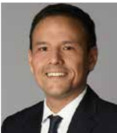
Cédric O , secrétaire d'État chargé du Numérique

Mariya Gabriel est l'actuelle commissaire européenne à l'économie et à la société numériques. Elle a été vice-présidente du groupe PPE au Parlement européen de 2014 à 2017. Mariya Gabriel a été membre du Parlement européen, PPE / GERB (Citoyens pour le développement européen de la Bulgarie) de 2009 à 2017. Depuis 2012, Mariya Gabriel a été vice-présidente d'EPP Women. Auparavant, elle a été secrétaire parlementaire des députés du parti politique GERB au sein du Groupe PPE en 2008-2009. Outre les activités du Collège, elle participe aux travaux préparatoires liés au marché unique numérique, à l'Union de l'énergie, à l'amélioration de la réglementation et les affaires interinstitutionnelles, au budget et aux ressources humaines, et à l'emploi, la croissance, l'investissement et la compétitivité. Ses responsabilités comprennent le lancement de propositions ambitieuses pour l'achèvement d'un marché unique numérique, le soutien au développement des industries créatives et d'une industrie européenne des médias et des contenus prospère, ainsi que d'autres activités visant à renforcer la capacité d'innovation de l'Europe. Elle est engagée dans la promotion des droits et de l'autonomisation des femmes.