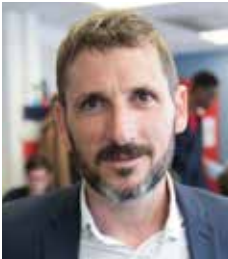
Matthieu Orphelin , député du Maine et Loire, co-fondateur du collectif « Accélérons la transition »