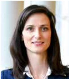
Mariya Gabriel , commissaire européenne chargée de l'Économie et de la Société numériques

Mariya Gabriel est l'actuelle commissaire européenne à l'économie et à la société numériques. Elle a été vice-présidente du groupe PPE au Parlement européen de 2014 à 2017. Mariya Gabriel a été membre du Parlement européen, PPE / GERB (Citoyens pour le développement européen de la Bulgarie) de 2009 à 2017. Depuis 2012, Mariya Gabriel a été vice-présidente d'EPP Women. Auparavant, elle a été secrétaire parlementaire des députés du parti politique GERB au sein du Groupe PPE en 2008-2009. Outre les activités du Collège, elle participe aux travaux préparatoires liés au marché unique numérique, à l'Union de l'énergie, à l'amélioration de la réglementation et les affaires interinstitutionnelles, au budget et aux ressources humaines, et à l'emploi, la croissance, l'investissement et la compétitivité. Ses responsabilités comprennent le lancement de propositions ambitieuses pour l'achèvement d'un marché unique numérique, le soutien au développement des industries créatives et d'une industrie européenne des médias et des contenus prospère, ainsi que d'autres activités visant à renforcer la capacité d'innovation de l'Europe. Elle est engagée dans la promotion des droits et de l'autonomisation des femmes.